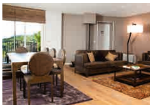
Salle à manger et salon donnant sur le jardin.