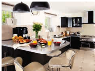
Une cuisine parfaitement équipée... digne d'un grand chef !