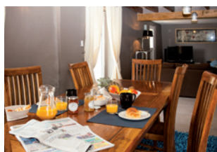
Séjour et salon donnant accès au jardin.