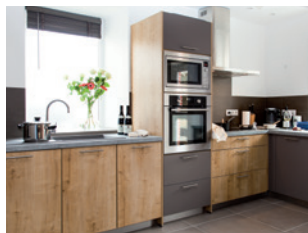
Une cuisine parfaitement équipée.